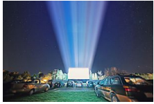
El Autocine más grande de Europa abre en Madrid VIAJAR