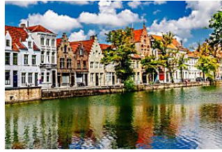
Flandes en Marzo VIAJAR