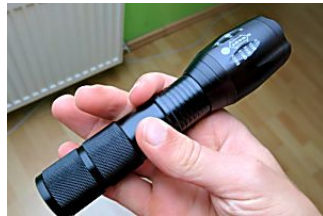
La Linterna Táctica muy potente que los Expertos recomiendan Lumify X9