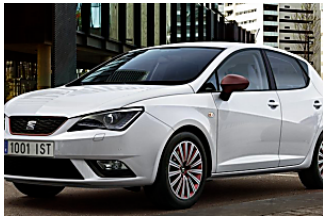
Seat Ibiza: toda la potencia de un motor de gasolina pero con la increíble eficiencia de un motor Seat.es