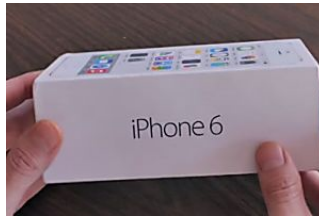
Los expertos están en shock. Este curioso truco online permite conseguir gangas en España RinconRed