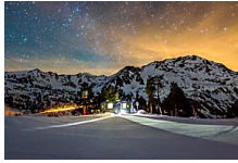
Las estrellas del Pirineo desde la cama VIAJAR